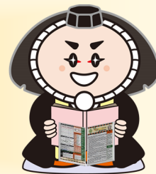
小松市イメージキャラクター カブッキー