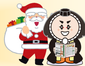
小松市イメージキャラクター「カブッキー」