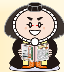
小松市イメージキャラクター「カブッキー」